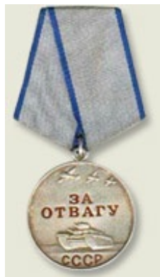
Медаль «За отвагу»