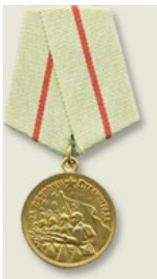
Медаль «За оборону Сталинграда»