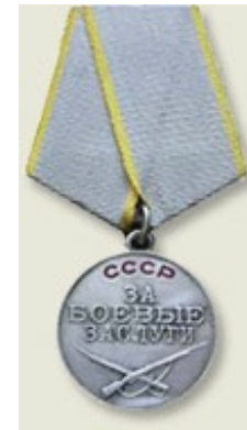
Медаль «За боевые заслуги»