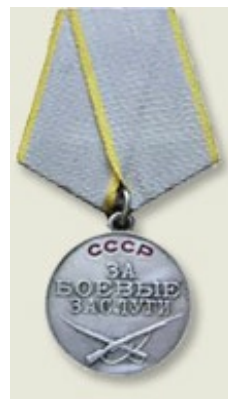
Медаль «За боевые заслуги»